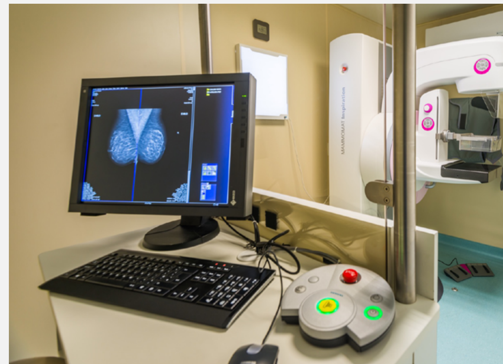
Estrutura interna do Sesc Saúde Mulher